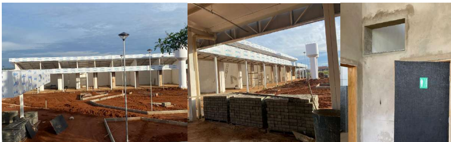
Figura 4: Evolução das obras do Centro de Convivência e Inovação, Campus Paraíso. Imagens de maio de 2025.

A Universidade Federal de Lavras (UFLA), por meio do Campus São Sebastião do Paraíso, retoma em 2025 a construção do remanescente do Prédio das Engenharias, um projeto estratégico para o fortalecimento do ensino, da pesquisa e da extensão na área tecnológica. A obra havia sido paralisada após a falência da empresa vencedora da licitação anterior e agora será executada com novo planejamento e aporte financeiro.