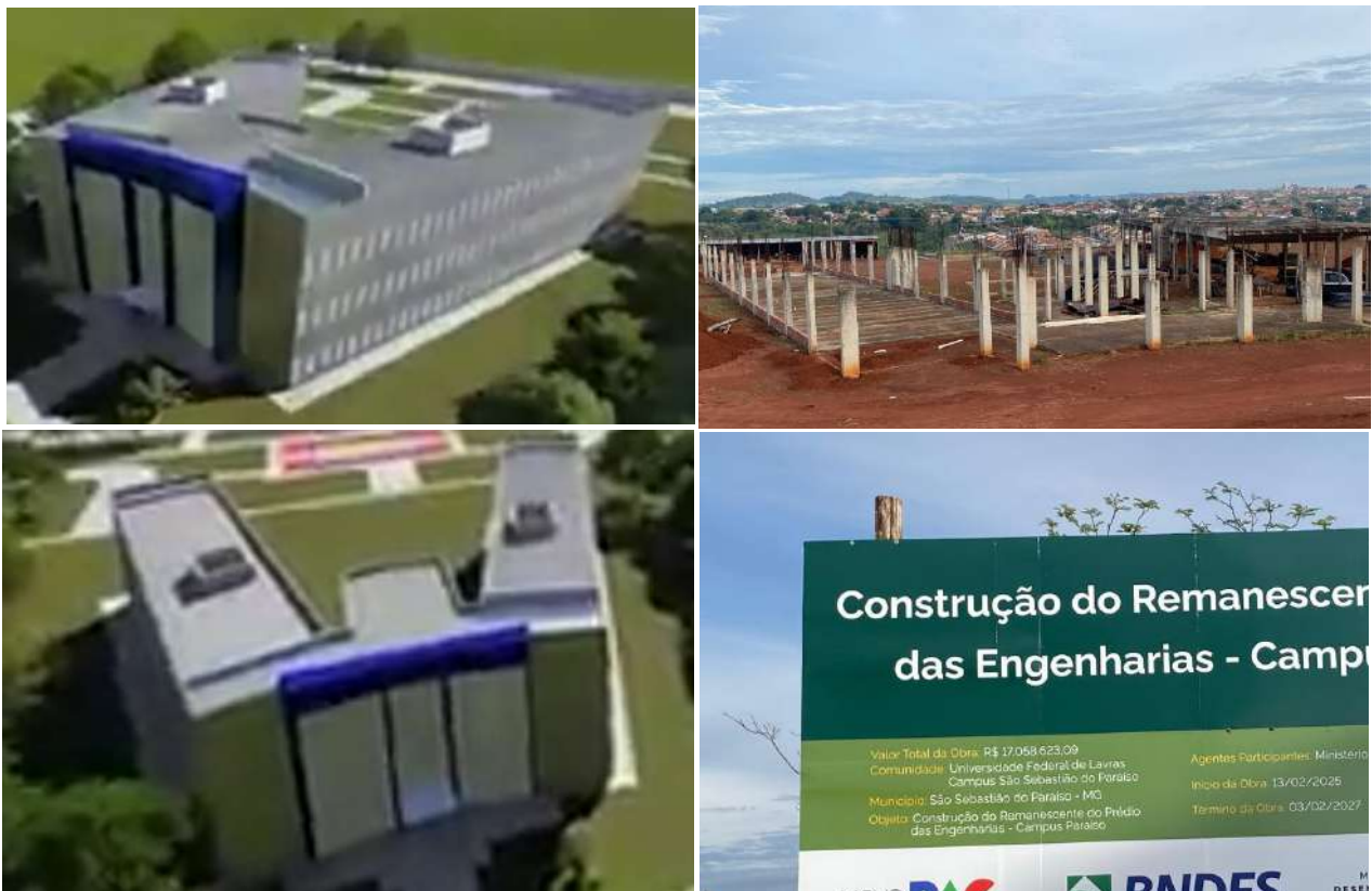
Figura 5: À esquerda, projeto do Prédio das Engenharias; à direita, imagens das obras do prédio em maio de 2025, no Campus Paraíso.

para fevereiro de 2027. Essa estrutura será essencial para o fortalecimento dos cursos de engenharia e para o atendimento de demandas práticas e acadêmicas da comunidade estudantil