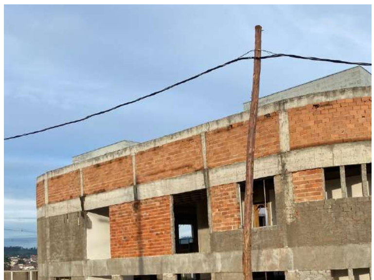
Figura 6: Obras do prédio da Biblioteca, com vista lateral na foto à esquerda e vista frontal na foto à direita. Campus Paraíso. Imagens de maio de 2025.