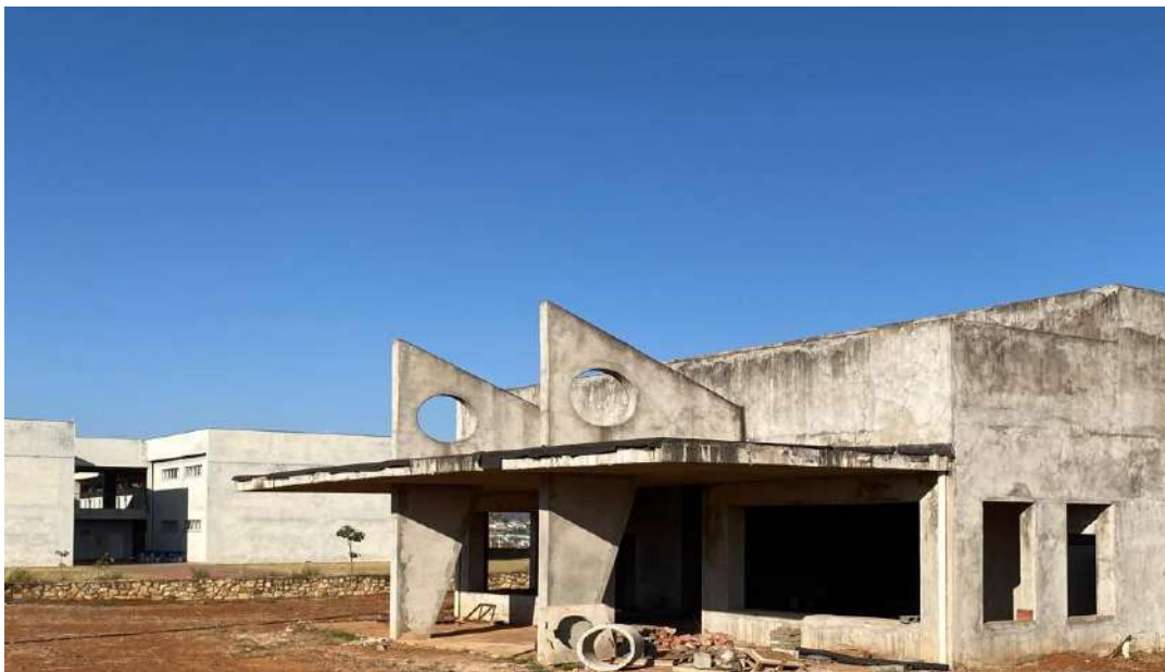
Figura 7: Estrutura do Anfiteatro do Campus Paraíso, o qual está em construção.

Atualmente, a obra está paralisada em razão da falência da empresa responsável pela execução do projeto inicialmente. No entanto, a Universidade Federal de Lavras está concentrando esforços para viabilizar sua retomada o mais breve possível, garantindo a continuidade dessa importante iniciativa para a comunidade acadêmica e para o fortalecimento das atividades institucionais no campus.