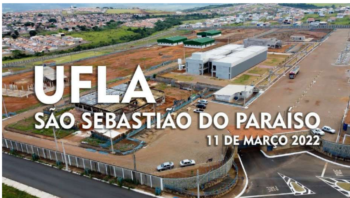
Figura 1: Imagem do Campus Paraíso no dia da sua inauguração.

Inaugurado em 2022, o campus nasceu a partir de um esforço conjunto entre a UFLA, o governo federal e a comunidade local, que visavam a criação de um polo de